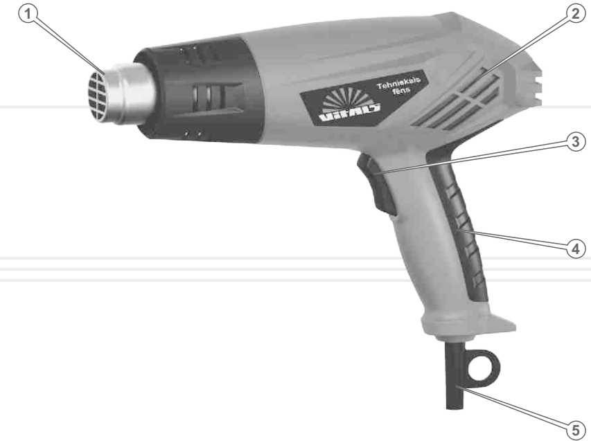
Специфікація до малюнка 1