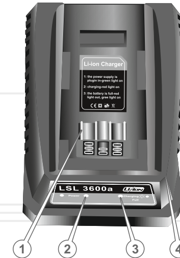
Специфікація до малюнка 1